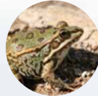
RANA COMÚN Pelophylax perezi