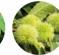
CASTAÑO COMÚN Castanea sativa