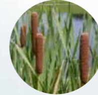
JUNCOS O ESPADAÑAS Typha latifolia