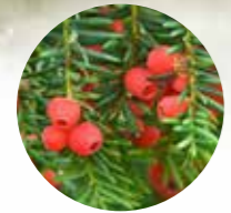
TEJO Taxus baccata