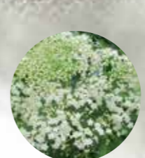
SAUCE Sambucus nigra