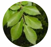
OLMO Ulmus sp.