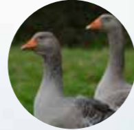
OCA O GANSO Gyps fulvus