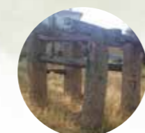
POTRO DE HERRAR

ANTIGUAMENTE SE UTILIZABA PARA PONER LAS HERRADURAS A LOS (ABALLOS, BURROS O MULAS. A LO LARGO DEL RECORRIDO HAY ESCULTURAS DE VIEJOS TOCONES DE OLMOS DEL PUEBLO, AFECTADOS POR LA GRAFIOSIS Y RECUPERADOS POR ARTISTAS DE LA ZONA.