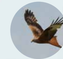
MILANO REAL Milvus milvus

LOS NIDOS (COLOCADOS FAVORECEN LA OBSERVACIÓN DE LAS AVES, TANTO LAS QUE SOBREVUELAN NUESTRAS CABEZAS COMO LAS AVES QUE VIVEN EN LA RIBERA DEL ARROYO.