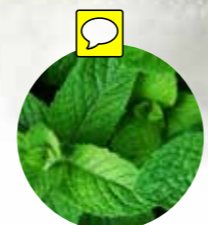
MENTA Mentha sp.

EN ESTA ZONA DIFERENTES PLANTAS AROMÁTICAS, PERO DESTACA UN IMPRESIONANTE SAUCE LLORÓN.