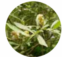
SAUCE Salix sp.