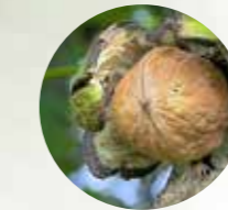
NOGAL Juglans regia