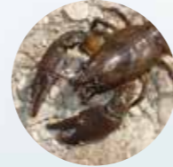
CANGREJOS Gyps fulvus