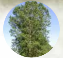
ÁLAMO Populus sp.