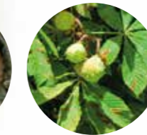
CASTAÑO DE INDIAS Aesculus hippocastanum